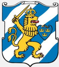
City of Gothenburg